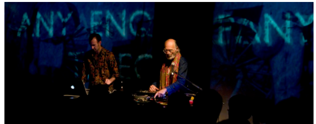
昨年度[第16回]文化庁メディア芸術祭受賞作品展の様子