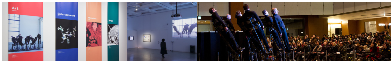
昨年度[第16回]文化庁メディア芸術祭受賞作品展の様子

このたび、文化庁メディア芸術祭実行委員会は、「平成25年度[第17回]文化庁メディア芸術祭受賞作品展」を2014年2月5日(水)から2月16日(日)まで、東京・六本木の国立新美術館を中心に開催します。